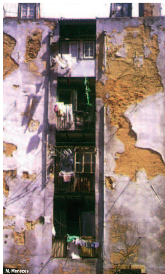
fig. 4 Immeuble dégradé du quartier de la Mouraria

a été trouvé mort ici et elle est venue demander, et nous avons fait une cérémonie pour lui; on contribue, parfois, à ces choses-là. Mais jusque-là (...), ceux qui apparaissaient comme ça sans-abri, il y en avait peu, ils dormaient sur les escaliers de nos immeubles et on les laissait. On les connaissait, on commençait à parler, ils venaient de la campagne, n'arrivaient pas à trouver du travail, et ils devenaient alcooliques et nous on les laissait dormir; ils ne faisaient rien de mal, ils n'urinaient pas dans la rue, ils ne faisaient rien que l'on puisse leur reprocher. Ici arrivait pas mal de monde des provinces et nous on les aidait comme on pouvait. Aujourd'hui on peut plus, hein? Parce qu'il y en a tant qu'il n'y a plus de possibilité de faire quoi que ce soit. » (D. Júlia)