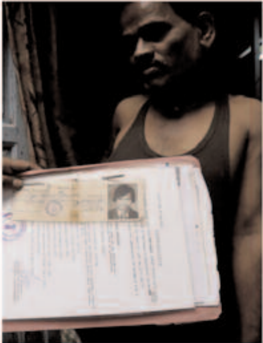
fig. 3 Carte d'accès à la procédure de relogement