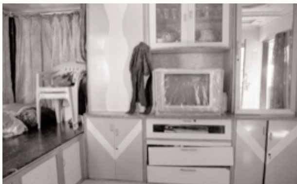
Ahmed Zakarya Nagar/Behrampada, 17 m2