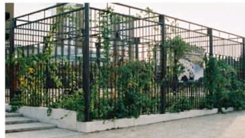
Les grilles du jardin