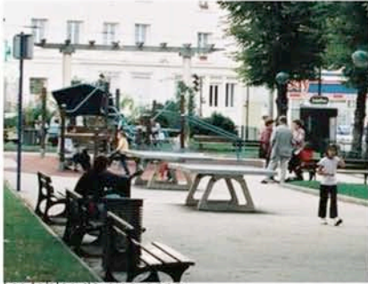
Les tables de ping-pong