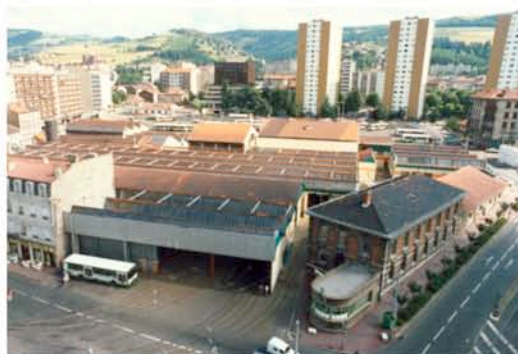
Le dépôt de la STAS (à droite, le bâtiment de l'horloge)