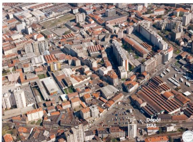
Vue hélicoptère (années 70 environ)