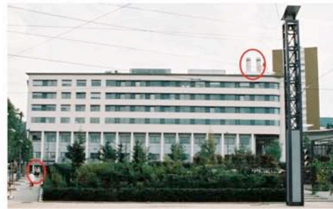
La clinique : les cheminées sont indiquées en haut à droite et le funérarium en bas à gauche