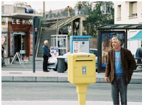
La passerelle qui mène vers les lycées