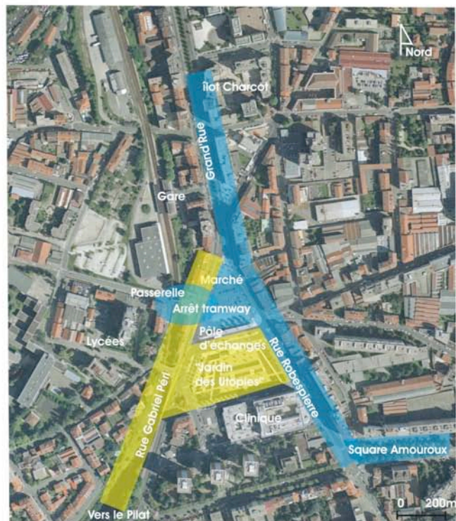
Fig. 7 : "configuration" de la place par les jeunes.

Les plus jeunes privilégient la rue Robespierre (les cafés) et le lieu formé par la passerelle et l'arrêt de tramway (bleu). Les moins jeunes agrègent à ces lieux, le marché et le square (bleu). En revanche, le jardin, le pôle et la rue G. Péri sont "annulés" (jaunes).