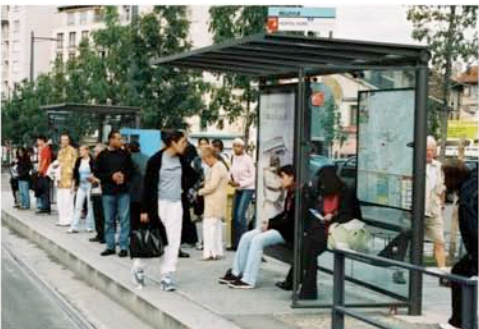
L'arrêt de tramway