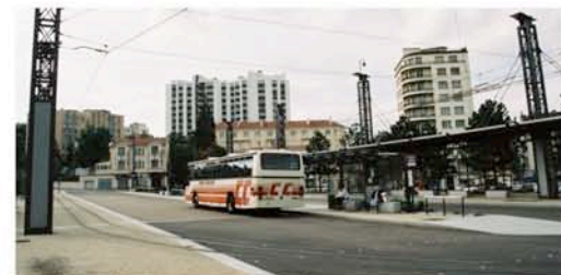
Le pôle d'échanges