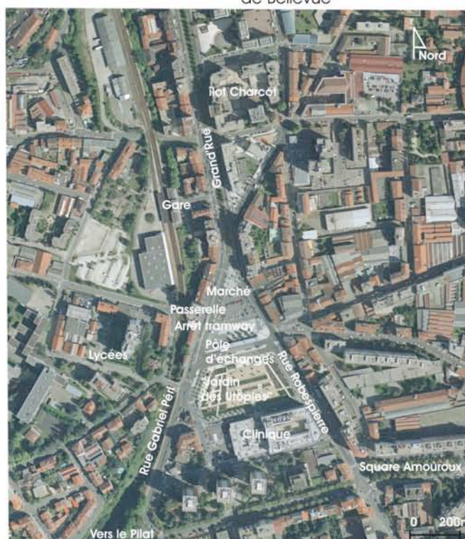
Vue aérienne après aménagement 2000