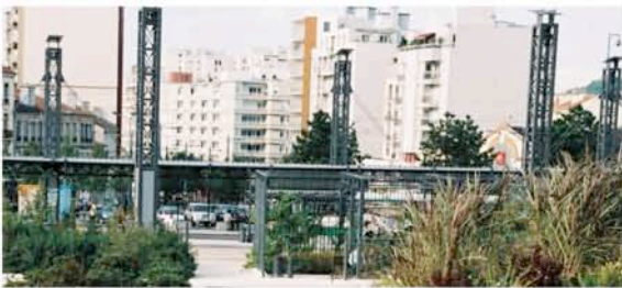
Les grilles du jardin et les mâts du pôles