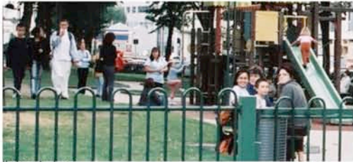
l'aire de jeux