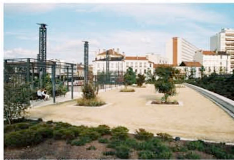
Vue sur les grilles du jardin et les mâts du pôle en arrière plan