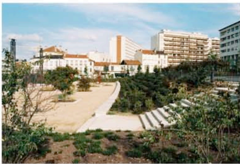
Le jardin vu de la rue G. Péri