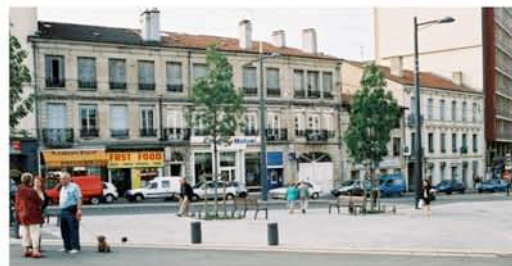
La rue G. Péri