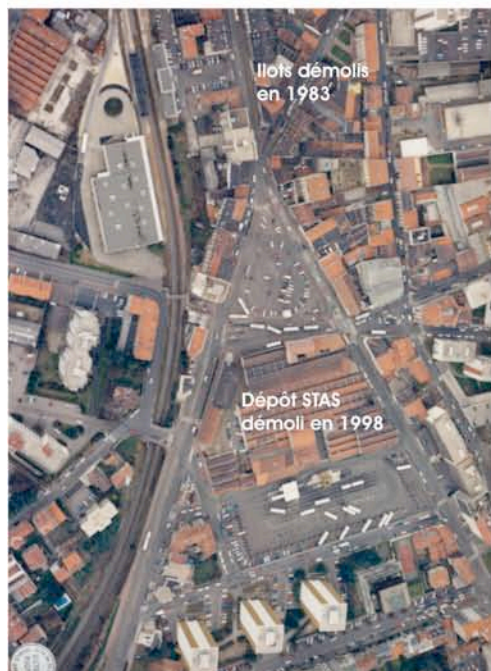
Vue aérienne (années 70 environ)