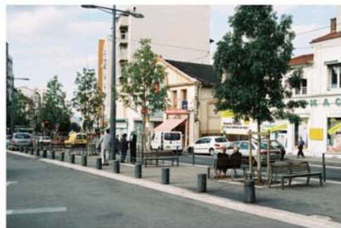
La rue Robespierre