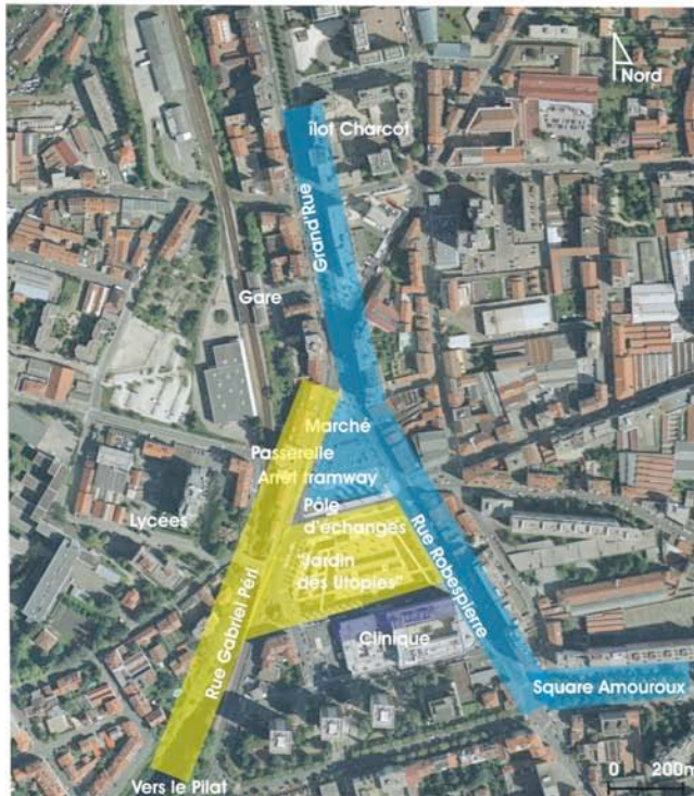
Fig. 7 : "configuration" de la place par les personnes âgées. Elles privilégient la rue Robespierre, le marché et le square (bleu), ensuite la clinique (violet). En revanche, le jardin, le pôle et la rue G. Péri sont "annulés"